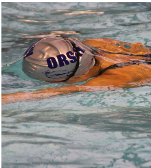
Meeting ou championnat en bassin de 50m

Le club organise des meetings dans le stade nordique extérieur de 50m, une installation unique en Essonne