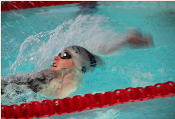
Des nageurs qualifiés à des compétitions de niveau départemental à national